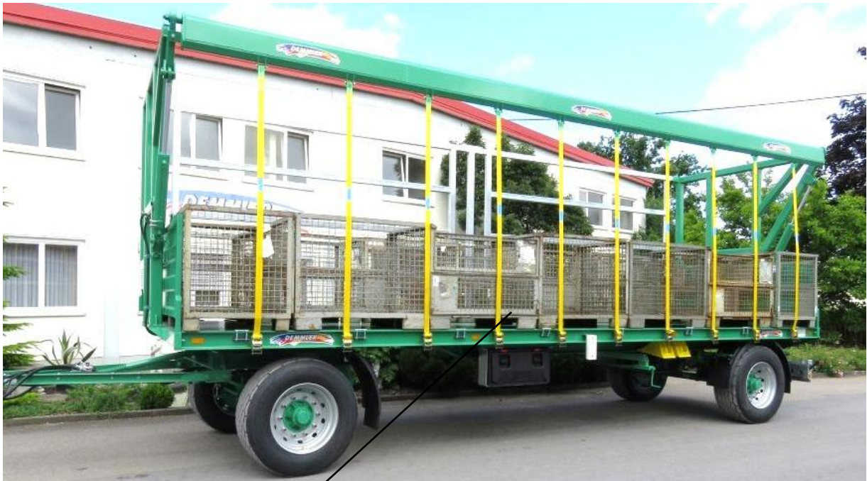
Zum Transport von Gitterboxen und Holzkisten geeignet!