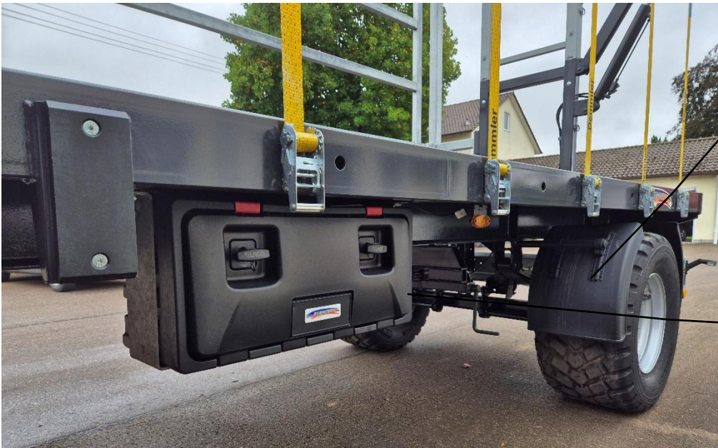
Kotflügel mit Halterung (Serie)