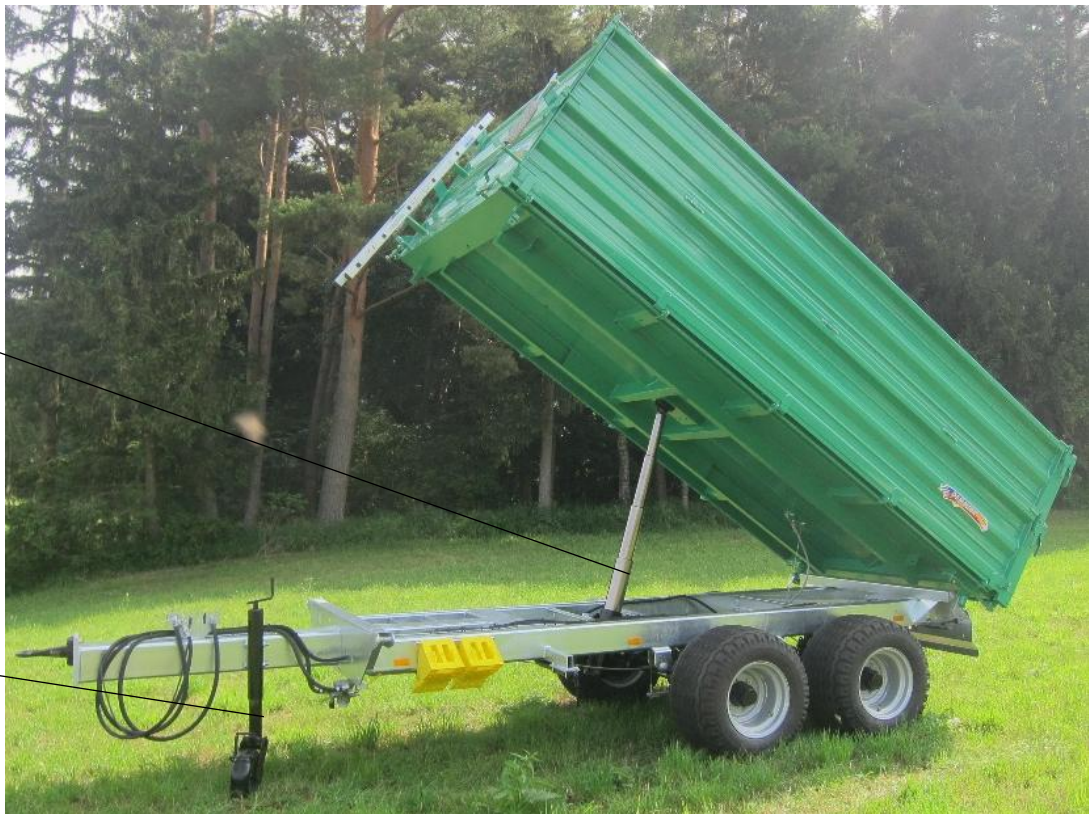
Stützrad bei TDK 90 L – TDK 140 L (Serie)