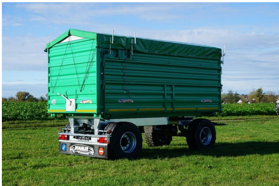
DK 180 L mit hydraulischer Rückwand (Aufpreis)