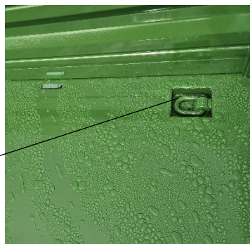
Zurmulden 5,3 versenkt (Aufpreis)