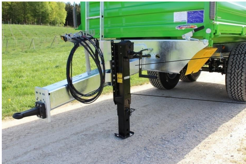
Stabile Zugeinrichtung (Serie)