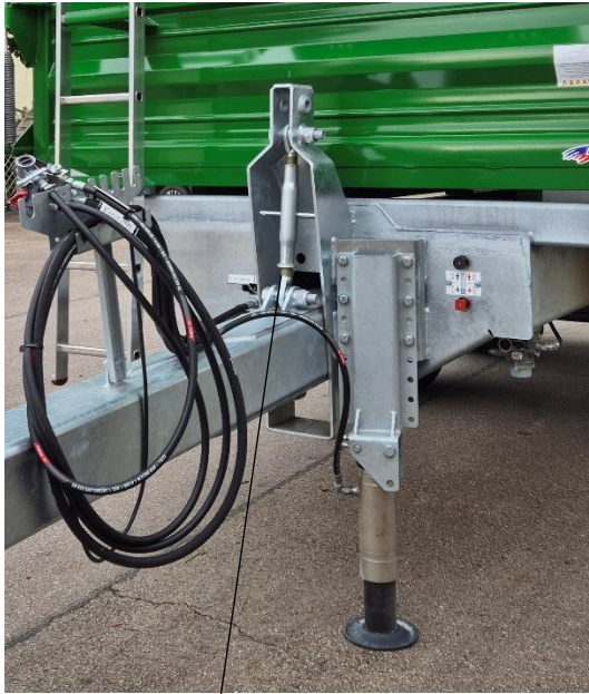
Mechanisch verstellbare Deichsel für Oben-o. Untenanhängung b. TDK 160/5 – TDK 200 L (Aufpreis)