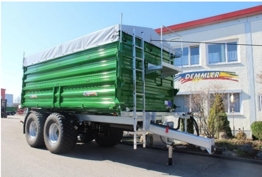
Rollplane mit Aufbauspitzen und Podest (Aufpreis)