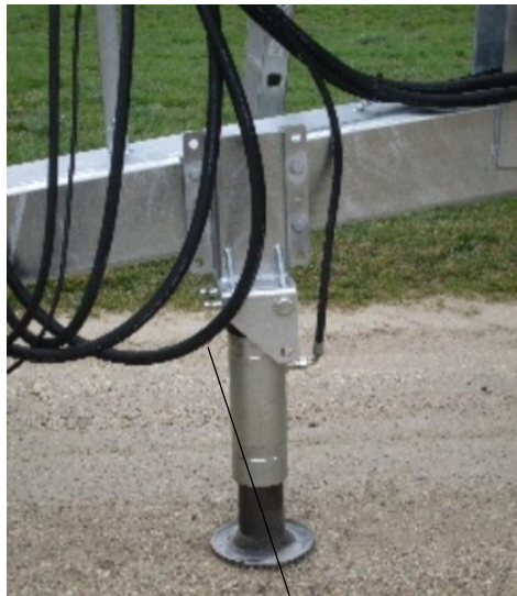
Hydraulischer Stützfuß (Aufpreis)