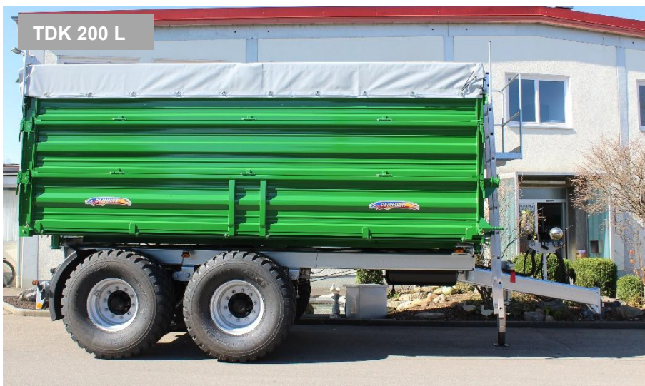
TDK 200 L