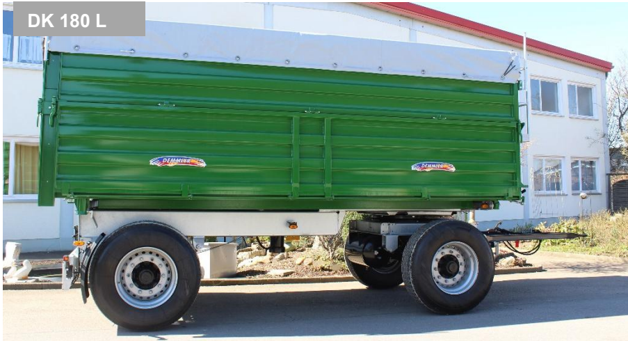
DK 180 L

Seit über 125 Jahren Erfahrung Ihr Partner in allen Transportlösungen!