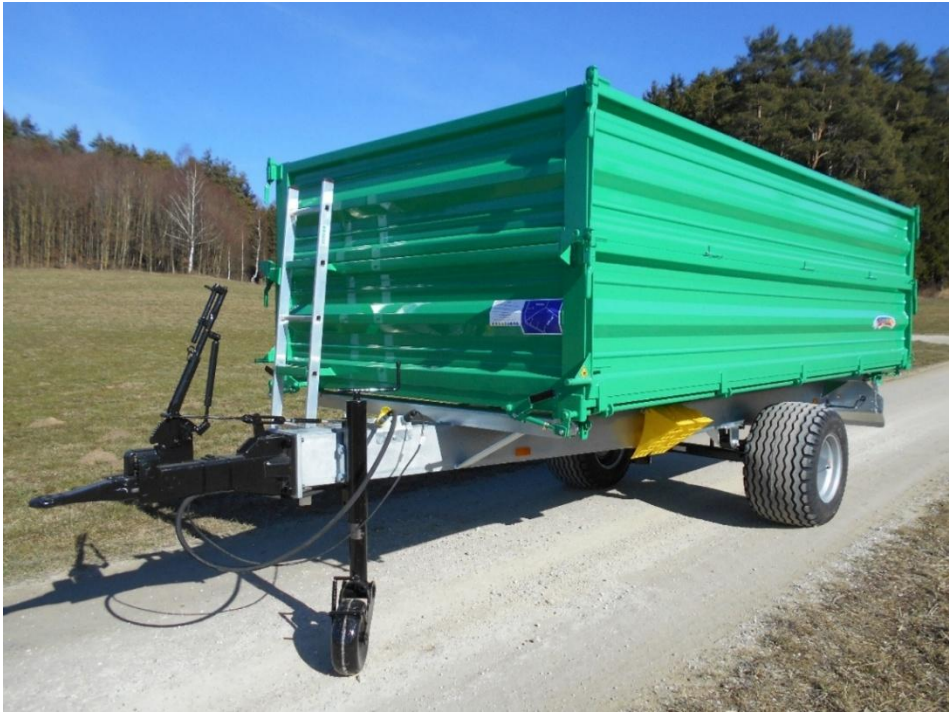
EDK 80 L mit Auflaufbremse