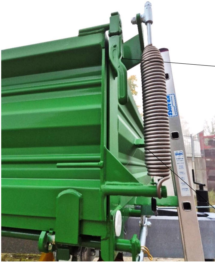
Stabile Bordwandverschlüsse (Serie)