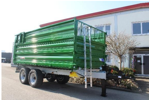
Sichtgitter vorne im 3. Aufbau 600 mm (Serie)