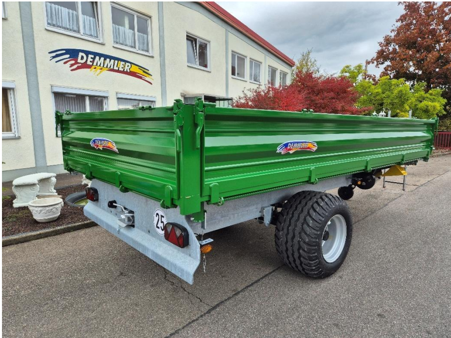
Breite Reifen gegen Aufpreis erhältlich