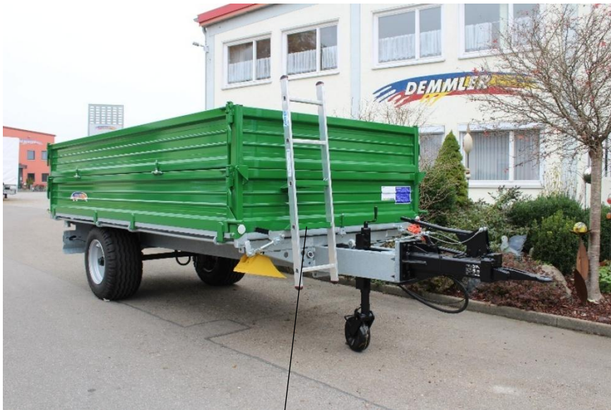
Aufstiegsleiter bei Bordwandaufsatz (Serie)