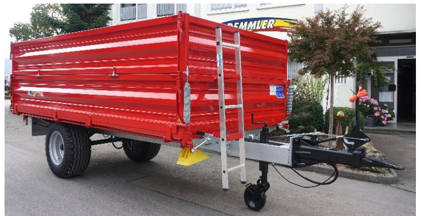
Sonderlackierung im Ral-Farbton (Aufpreis)