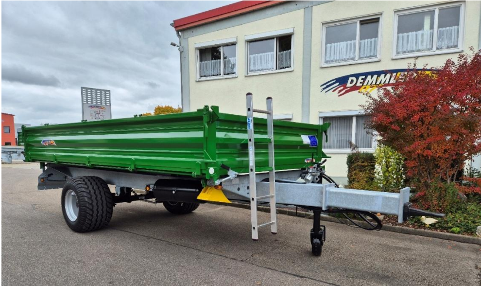
EDK 80 L mit Druckluft