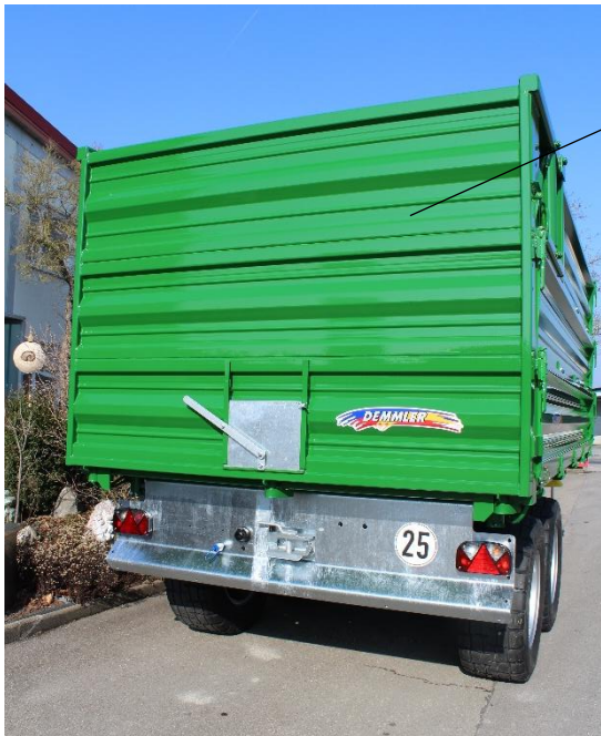
Hydraulische Rückwand mit 3. Aufbau 600 mm (Aufpreis)