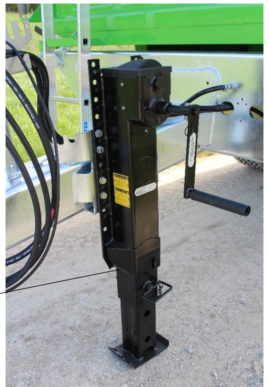
2-Gang-Getriebestützwinde (Aufpreis bei EDK 80 L u. TDK 80 L)