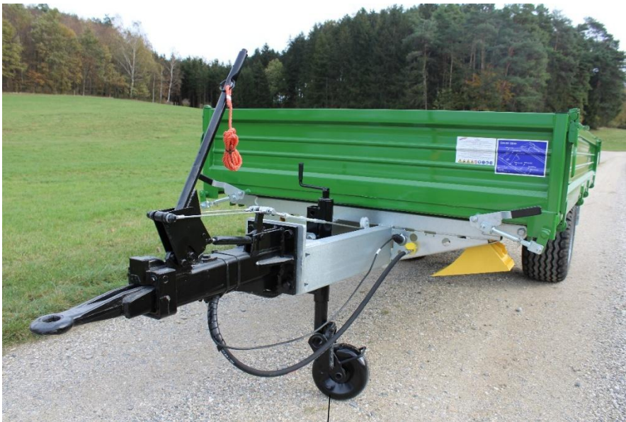
Stützrad (Serie bei allen Modellen)