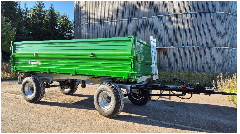
Kornschieber u. Aufsatzbordwände (Aufpreis)