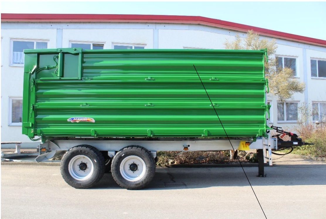
TDK 80 L