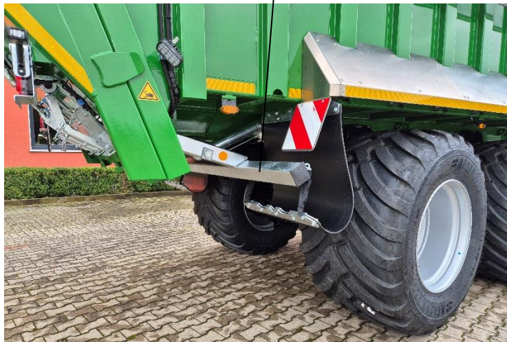
Hydr. betätigter Unterfahrschutz (Serie)