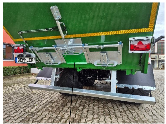
Hydr. betätigter Kornschieber 3--fach einzeln zu öffnen (Aufpreis)