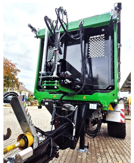
Die hydraulisch gefederte Zugdeichsel für Untenanhängung bietet höchsten Fahrkomfort, auch bei hoher Geschwindigkeit.