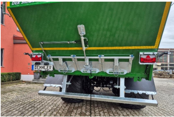
Hydr. betätigter Kornschieber 3--fach (Aufpreis)